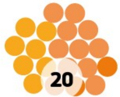
Webmeeting IV - 07.07