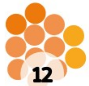
Webmeeting I - 03.02.