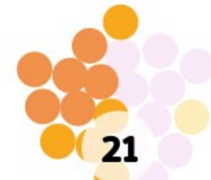
Keiner Davon / Weiß ich nicht