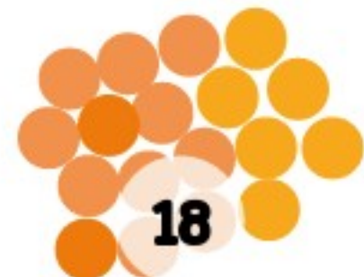
Webmeeting V - 09.09