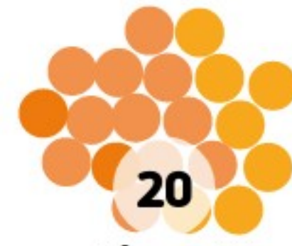
Webmeeting III - 05.05