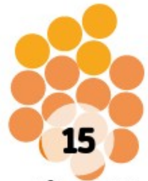
Webmeeting II - 24.03.